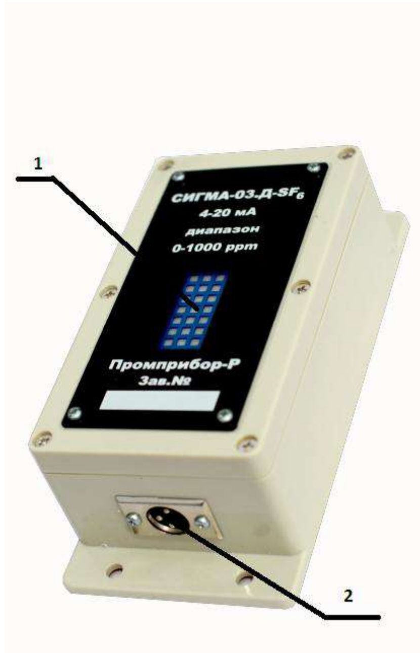
Рис.1. Внешний вид датчика СИГМА-03.Д-SF6.